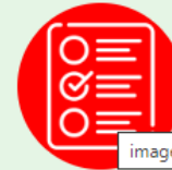
imagen Encuesta de satisfacción